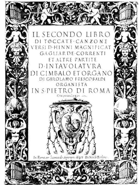
Frontespizio di 2b

Rochester: Vault M 22 F 884 folio (I + II legati assieme; olim Wolfheim) Roma BCL: Mus. F.3 (solo II) Roma BC: Mus. 611/1 (I libro mancante nelle pp. precedenti p. 7); Mus. 611/2 (II libro) Mus. 616 (I libro; mancano le due cc. iniziali prima della musica) Roma sc: G.CS.I.D.2-3 (I + II; nel I mancano le pp. 1-20) Rostock: Mus. Saec. XVII. 18.-15. (I + II legati assieme, danneggiati e mal rilegati) Siena AC: II.1.F.4 (I + II legati assieme) Toronto: G-b 151 (I + II legati assieme, nel II manca la c. 2) Venezia BNM: Mus. 40 (solo II); Mus. 589/590 (I + II) Vicenza: FF.2.7.1 (I + II legati assieme) Vienna NB: SA.76.A.1 (I + II legati assieme; olim Convento di S. Francesco di Perugia dei Minori Conventuali) Washington LC: M22.F92 Case (I + II legati assieme)