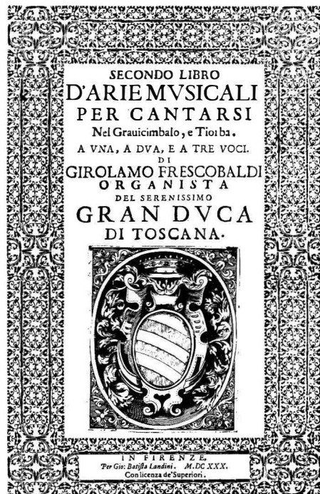
Frontespizio di 12

A p. 3, sotto un fregio identico alla cornice del frontespizio: All'illustriss. ma Sig. te e patron mio Colendiss. mo il Sig. ro / MARCHESE ROBERTO OBIZI / CAVALLERIZZO MAGGIORE / DEL SERENISSIMO / GRANDVCA / DI TOSCANA.