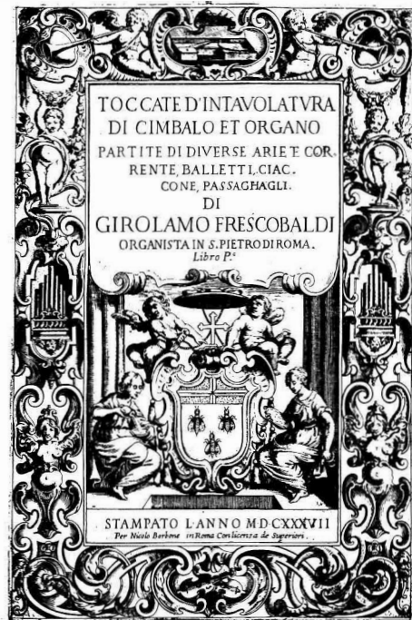
Frontespizio di 1e

Trattandosi di edizione fatta in coppia con il Libro II, anche gli esemplari dei due libri sono di regola conservati assieme; pertanto si rinvia all'elenco degli esemplari in calce al n. 2b.