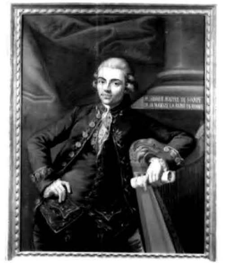
Figura di giovane in posizione classica con un braccio poggiante su di un'arpa; nella mano tiene uno spartito arrotolato. Dietro, un tendone e, a sinistra, basamento e tronco di colonna.